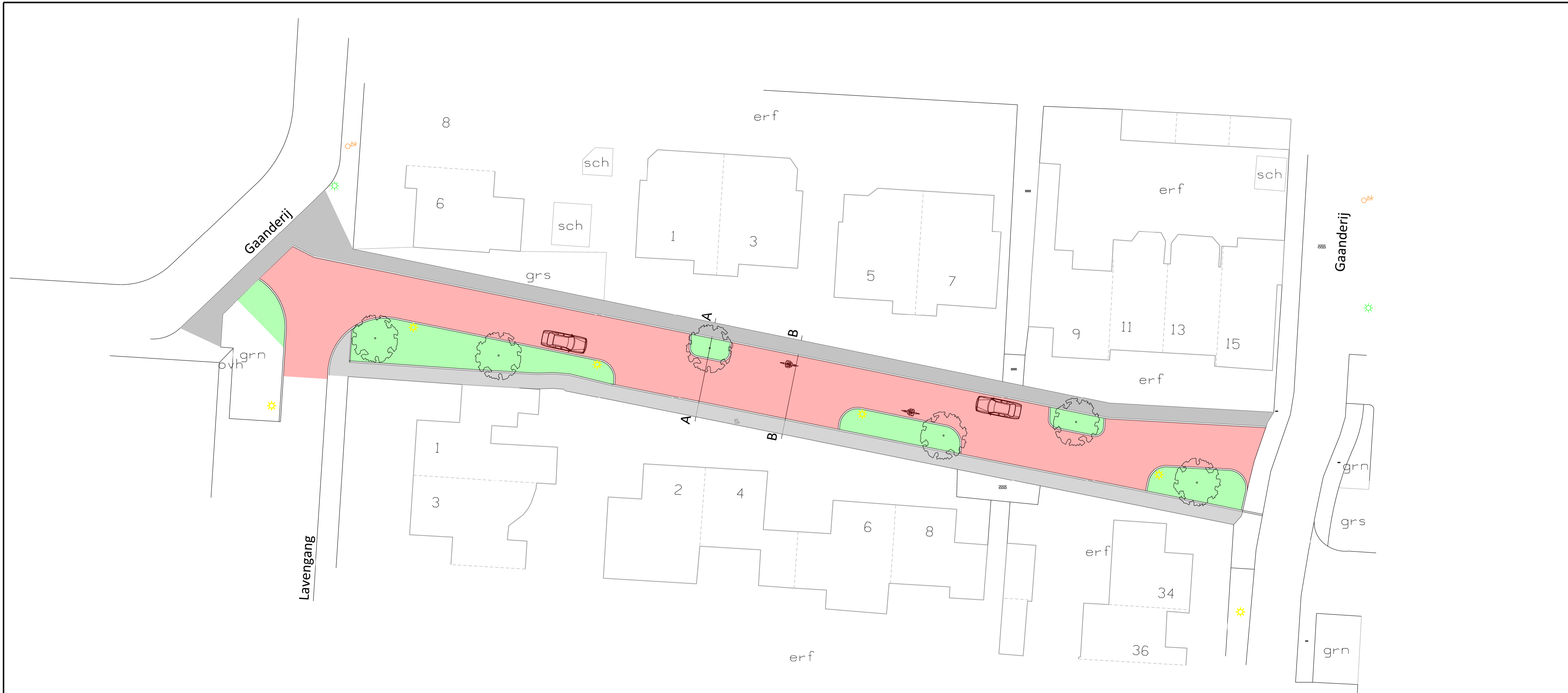
A - A