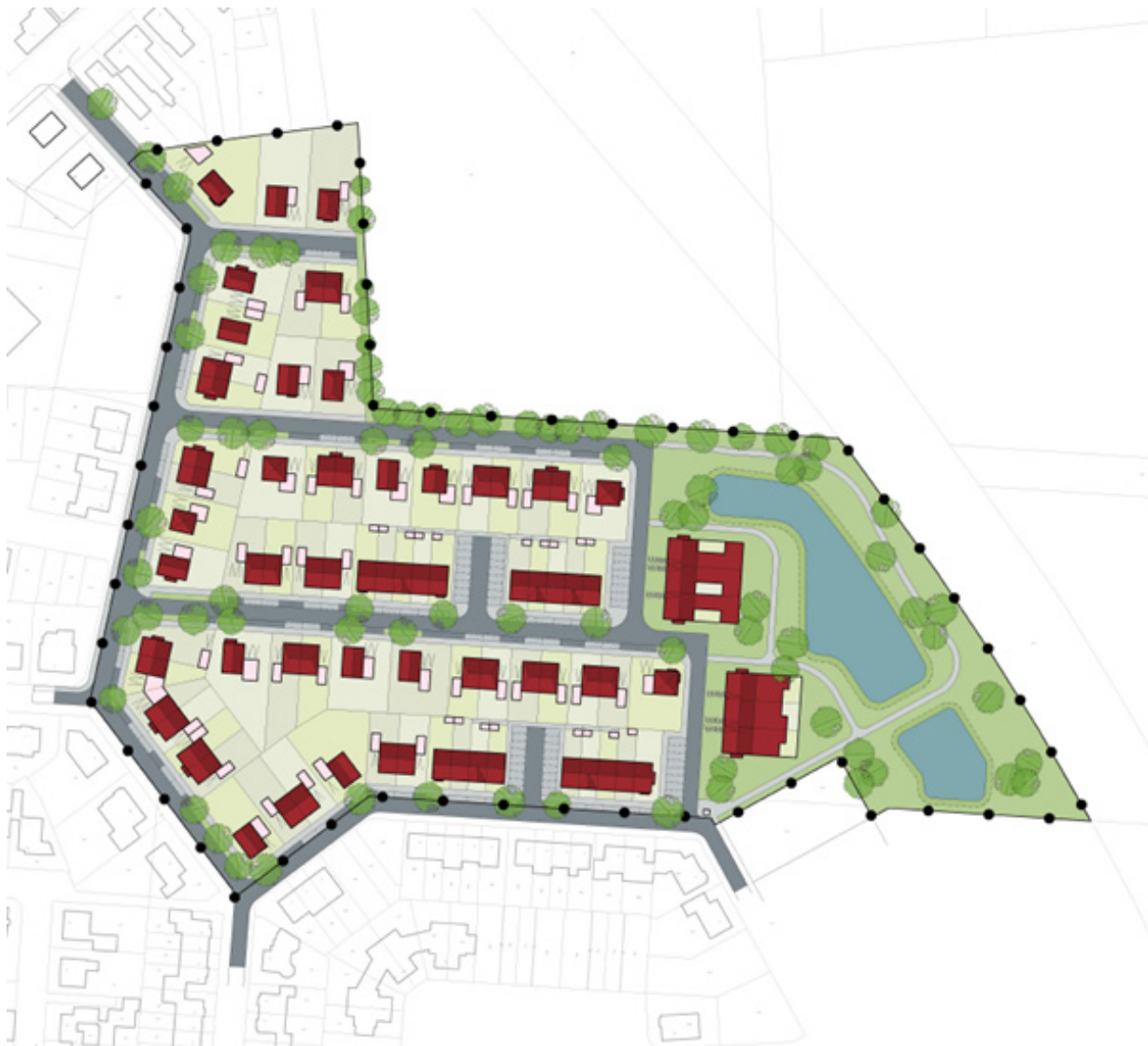
Concept verkavelingsplan De Ligt IV

Eind 2015 is een concept verkavelingsplan gemaakt voor De Ligt IV. Mede aan de hand van dit verkavelingsplan heeft de gemeenteraad in december 2015 ingestemd met de ontwikkeling van de locatie.