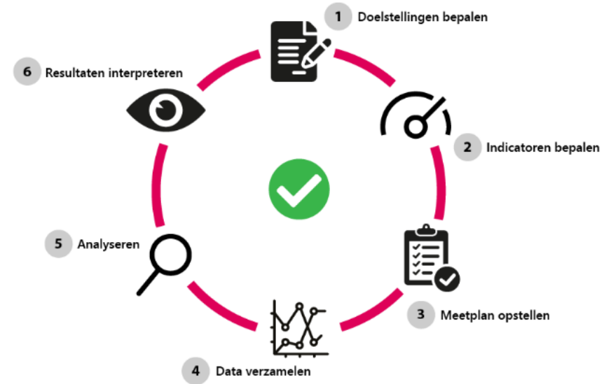
Cyclus van monitoring en evaluatie

Via monitoring en evaluatie kan tussentijds bijgestuurd worden. Voor hoe we dit gaan doen, stellen we een plan op. Hierin nemen we in ieder geval de momenten van evaluatie op en welke data we nodig hebben om de monitoring uit te voeren. Denk bijvoorbeeld aan periodieke parkeerdrukmetingen en verkeerstellingen. Via de planning-en-control cyclus rapporteren we over de voortgang.