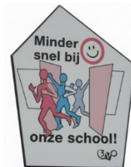
Schoolzone bord Galder

Het doel is om schoolzones en routes naar school duidelijker en veiliger te maken. We accentueren schoolzones door deze gebieden extra te benadrukken met markeringen en bebording en door snelheidsremmende maatregelen te treffen waar dit nog onvoldoende is toegepast. Daarnaast richten we ons op het veilig inrichten van fietspaden en oversteekplaatsen. Voor realisatie het nieuwe Kindcentrum Chaam worden er verbetermaatregelen genomen op de Gilzeweg.