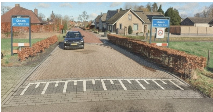
Voorbeeld van een duidelijke inrichting van een komgrens

Start en termijn uitvoering: Korte termijn