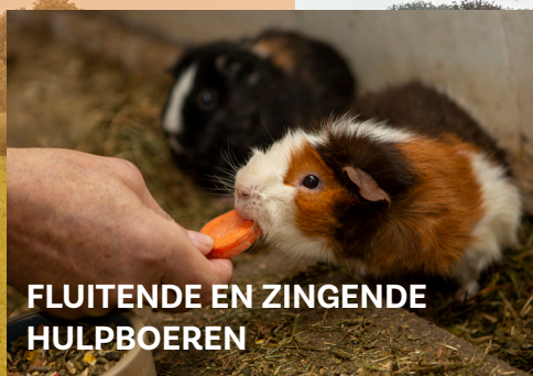
FLUITENDE EN ZINGENDE HULPBOEREN