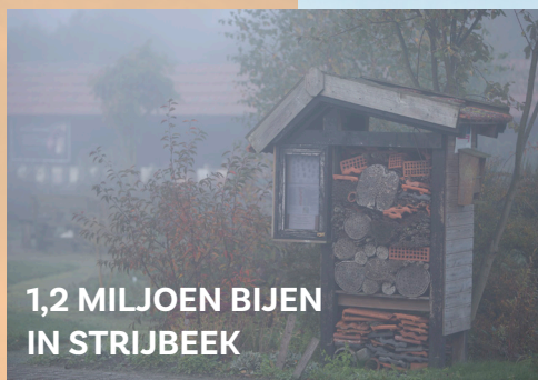
1,2 MILJOEN BIJEN IN STRIJBEK