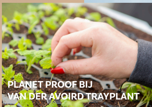
PLANET PROOF BIJ VAN DER AVOIRD TRAYPLANT